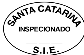
MODELO SEM ESCALA