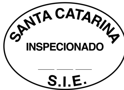
MODELO SEM ESCALA