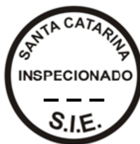
MODELO SEM ESCALA

d.2. Nos casos de etiquetas-lacres de carcaça e de etiquetas para identificação de caminhões tanques, o carimbo de inspeção deve apresentar a forma e os dizeres previstos no modelo 3 com 4cm (quatro centímetros) de diâmetro.