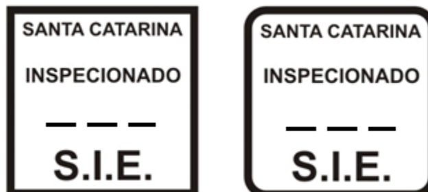
MODELO SEM ESCALA

d) USO: para rótulos, etiquetas ou sacarias de produtos não comestíveis;