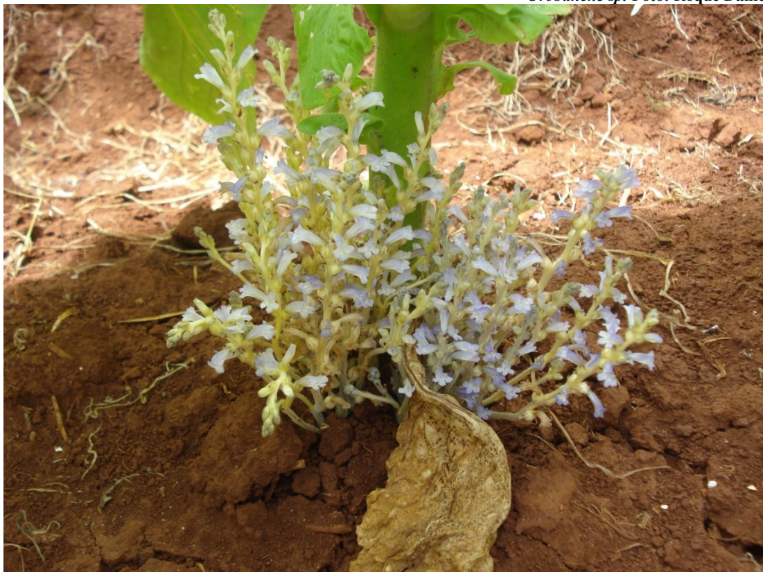
Orobanche sp.