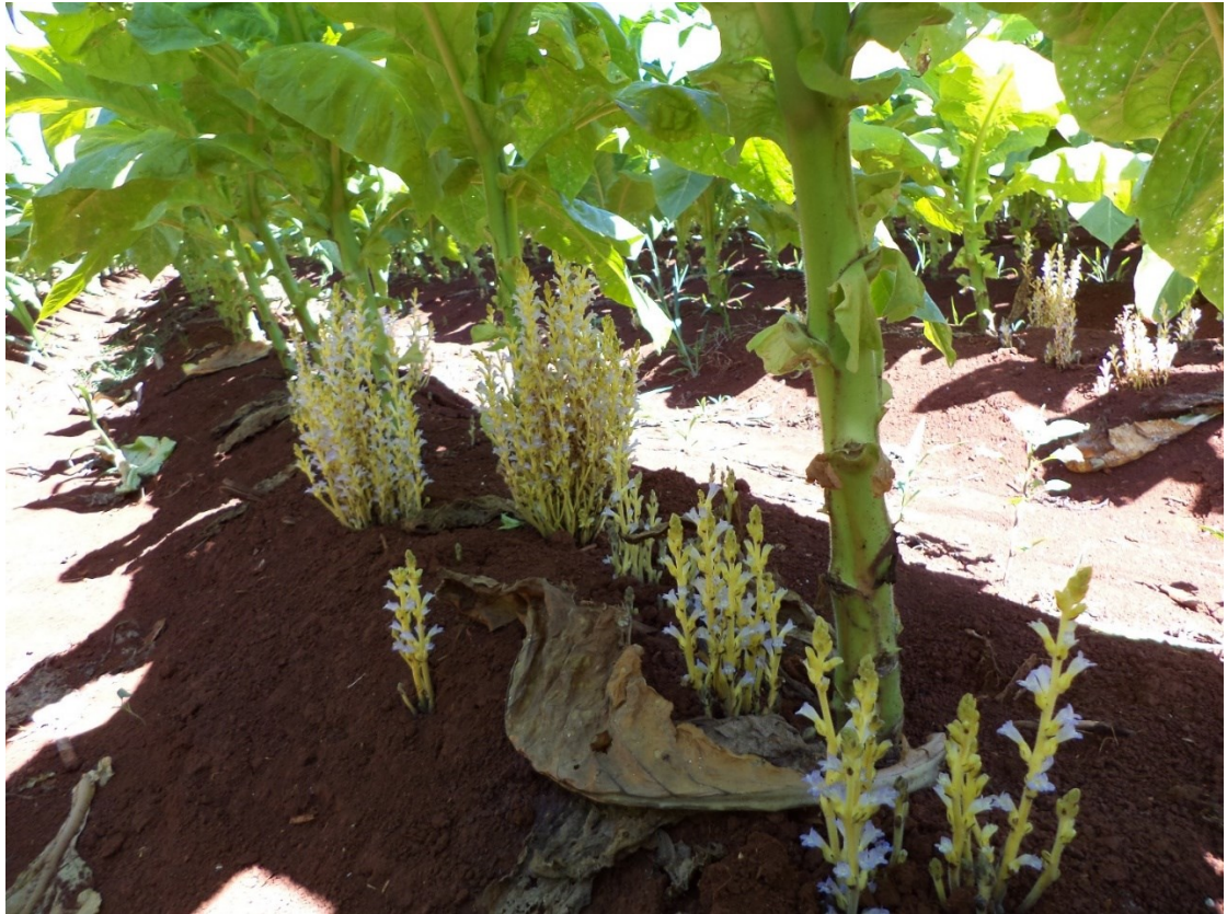
Orobanche sp.