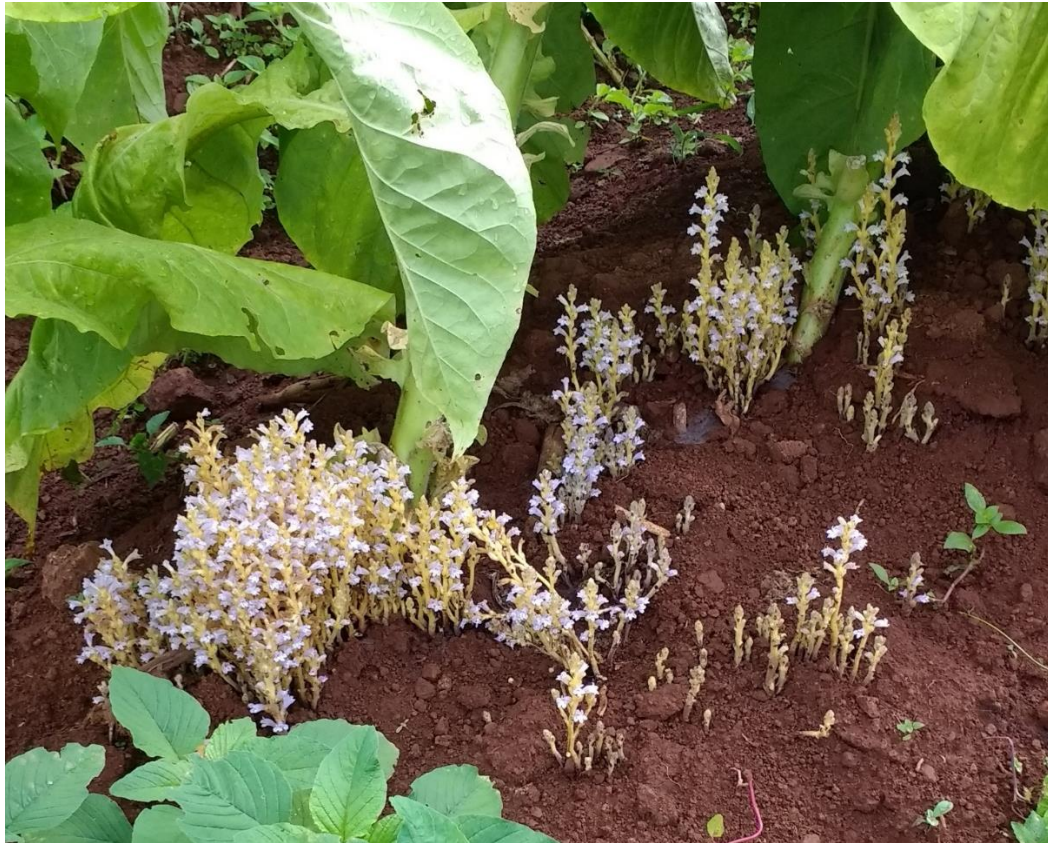
Orobanche sp.