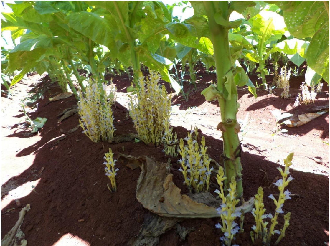
Orobanche sp.