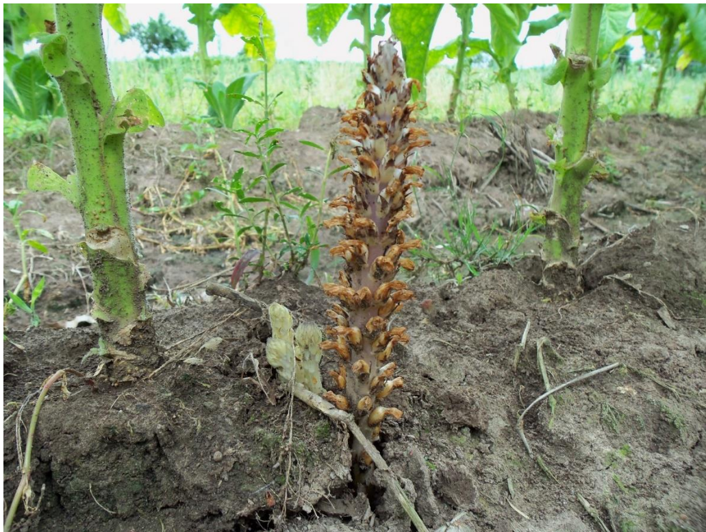
Orobanche sp.